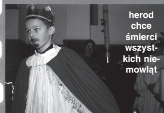
herod chce śmierci wszyst- kich nie- mowląt