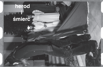
herod + śmierć