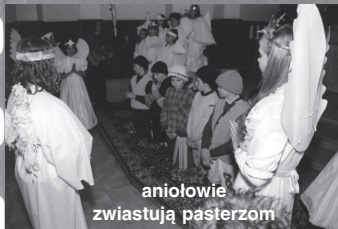
aniolowie zwiastują pasterzom