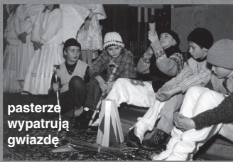
pasterze wypatrują gwiazdę