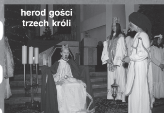
herod gości trzech króli