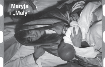
Maryja i „Mały”