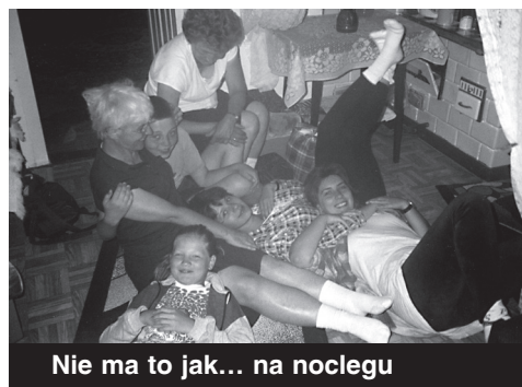
Nie ma to jak... na noclegu

Osoby, które ze wszystkich sił pomagały głębiej przeżyć tę pielgrzymkę