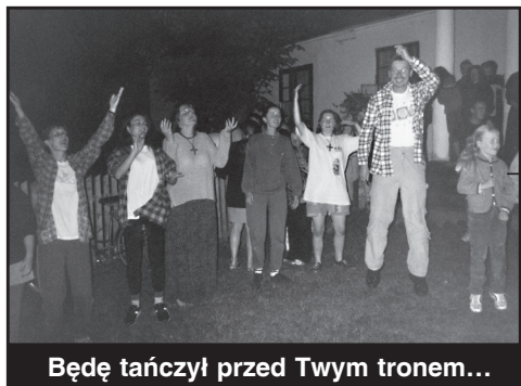
Będę tańczył przed Twym tronem...