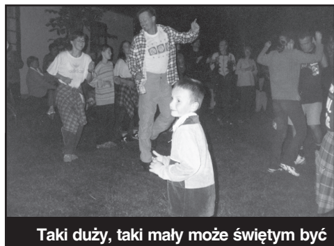
Taki duży, taki mały może świętym być