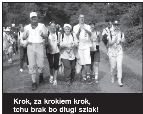
Krok, za krokiem krok, tchu brak bo długi szlak!