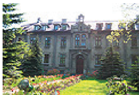
Pierwszy dom zakonny założony przez Matkę w Polsce - Kęty, Obecnie Dom Nowicjatu