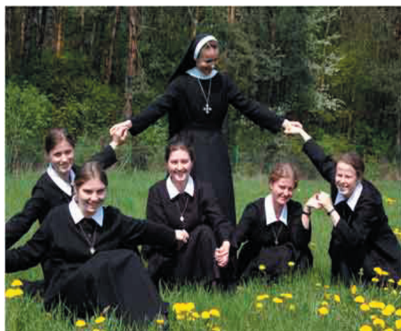
Siostry przygotowujące się do życia w Zgromadzeniu - Postulantki