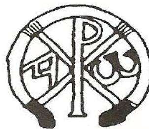
Alfa i Omega

Alfa symbolizuje początek, Omega – koniec i zarazem początek doskonałości. Chrystus sam siebie nazywa Alfą i Omegą (Ap). Łączenie tych liter z monogramem Chrystusa stało się zwyczajem IV w.