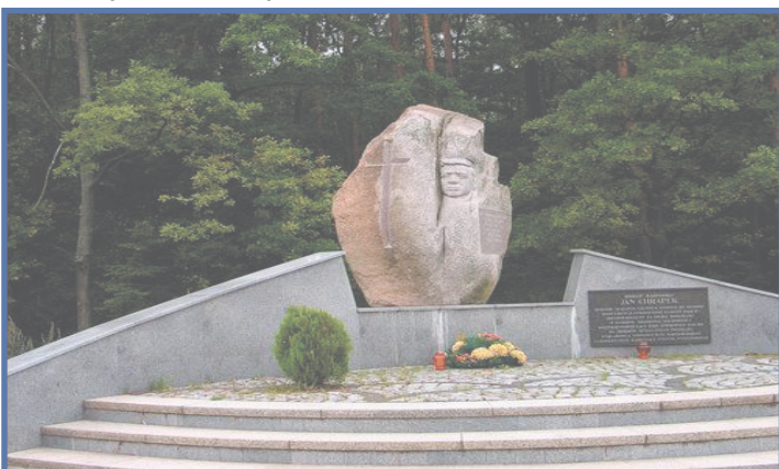
(pomnik w Sieklukach)

Był biskupem na nasze czasy. Mierzył siły na zamiary, nie wycofywał się z podjętych funkcji i obowiązków. Był uczynny i otwarty na każdego, choć najbardziej cenił sobie bliskie kontakty z ludźmi mediów. Często powtarzał, że to środowisko, łącznie ze studentami dziennikarstwa, którym służył, ubogaca go. Zaufanie ludzi zdobywał przede wszystkim tym, że był ludzki, prosty, otwarty, pracowity, zatroskany o innych. „Wcześniej osiągnąwszy doskonałość, przeżył czasów wiele. Dusza jego podobała się Bogu, dlatego pospiesznie wyszedł spośród nieprawości.” (Mdr 4,13-14a).